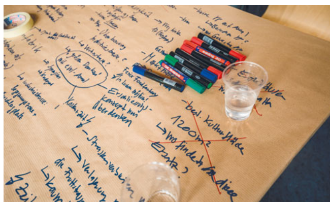
Packpapier, Stifte, Malerband und Wasser gehören zu jedem Workshop.