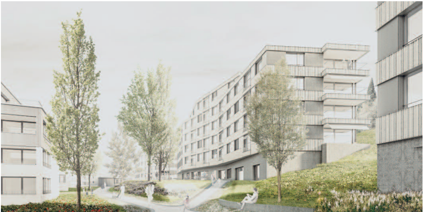
Die erneuerte Siedlung Obermaihof mit dem Mehrzweckgebäude (Mitte).

Text Benno Zraggen, Plan und Visualisierung phalt Architekten AG, Zürich